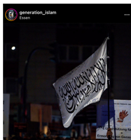
Abbildung 5: Screenshot der Postings (Bilder aus der Demo in Essen am 03.11.2023, Schahada-Flagge) der Gruppe GI auf Instagram