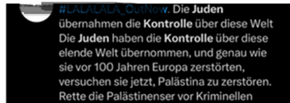
Abbildung 1: antisemitische Inhalte 10.11.2023, Screenshot (anonymisiert) auf X (Stand 30.11.2023)

Wir beobachten zunehmend antisemitische („Juden kontrollieren die Welt“, „Juden wollen Europa zerstören“) 1 und antimuslimische („Muslime kennen nur Hass und Gewalt“) Narrative und Inhalte im Kontext des aktuellen Konflikts auf TikTok, Instagram, Telegram, Facebook, X (ehemals Twitter) und YouTube in den jeweiligen Gruppen aber auch allgemein im Netz und in den Kommentarspalten der Nachrichten- und Zeitungsportalen außerhalb salafistisch-islamistischer Netzwerke. Die nachfolgenden Beispiele (Ausschnitte von Posts) auf der Plattform X beziehen sich direkt oder indirekt auf die aktuellen Ereignisse und zeigen, dass solche extremen Formen der Dehumanisierung und Dämonisierung von Jud*innen und Muslim*innen teilweise ungeahndet Verbreitung finden. Beide Beiträge vom 10.11. 2023 und vom 14.11.2023 sind bis heute öffentlich sichtbar und zugänglich (Stand 30.11.2023).