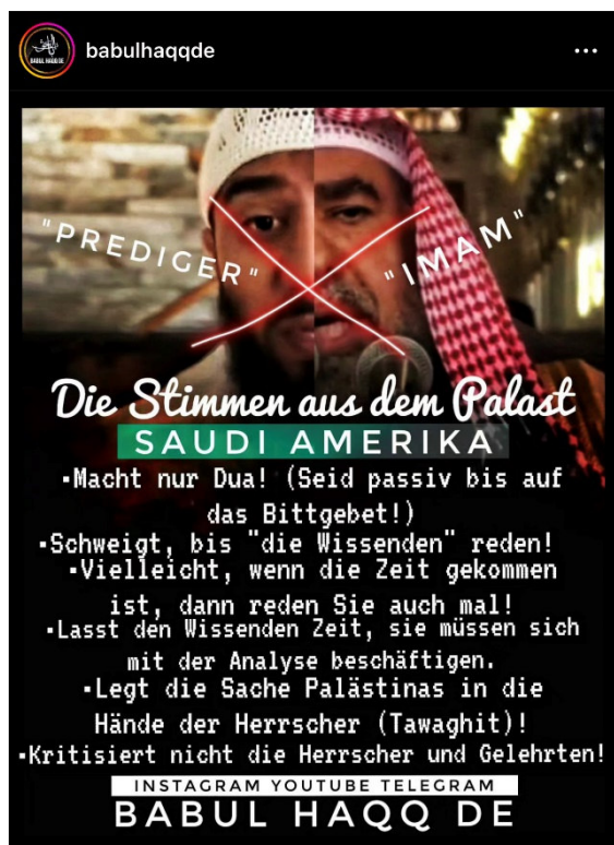
Abbildung 4: Screenshot eines Posts "Palastgelehrte" vom 27.11.2023 des Instagramkanals babulhaqqde

Die salafistischen Prediger, die jeglichen Aktivismus bezüglich dem Thema Palästina ablehnen und ihren Anhänger*innen abraten, sich dazu zu äußern, werden von einigen gegnerischen Akteur*innen teilweise auch abwertend als „Palastgelehrte“ 19 bezeichnet.